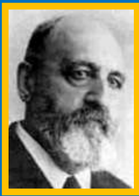
Leonardo Torres Quevedo (1852-1936)